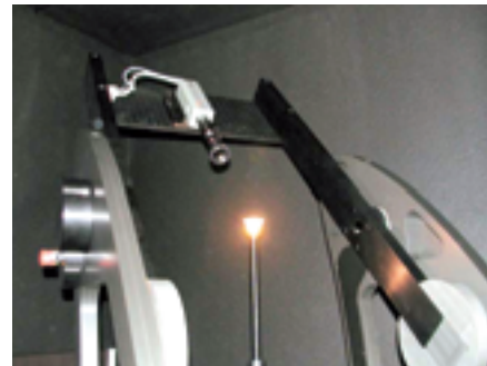
Messung am Goniometer.

Während die Lichtquelle um die senkrechte Achse gedreht wird, schwenkt der Rahmen mit der Kamera horizontal wie eine sich überschlagende Schiffschaukel über die Lichtquelle. Der Vorteil gegenüber der sonst eingesetzten Dreifachaufhängung, bei der drei Rahmen ineinander greifen, ist ein Zuwachs an Stabilität und Präzision des Messgeräts, was insbesondere bei kleinen Lichtquellen wie LEDs von Vorteil ist. Das Ergebnis einer Lichtquellenmessung sind viele Millionen von Strahlen, die mit einem